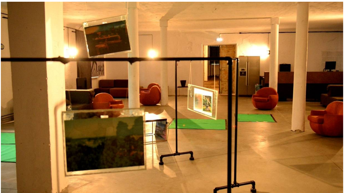
4. Neljas eksponeerimise päev, „Rem staadiumid 1,5“

„Rem staadiumid 1,5“ ehk unenägemise staadium, mis oli teoses kujutatud fotoinstallatsioonina. Topelt pildistatud fotofilmi väljaprinte ümbritsevad raamid, mille raske läbipaistev raam oli mänglev ruumi valgusega. Teosed seisid otsekui õhus ning olid sürrealistlikult meelestatud, et väljendada unenäo seisundit. Klaasist raamid lõid ruumi minimalistlikku tugeva, kuid puhta kompositsiooni. Fotod raamides olid illustratiivsed, kuid see oli narratiivset lugu rääkiv kunstniku argipäeva fotokunsti seeria. Iga päev toimus ruumis fotoinstallatsiooni kompositsiooni muutus, mil vahetasid asukohta nii fotod kuid ka valgus muutus ruumis. Need muutused olid spontaansed.