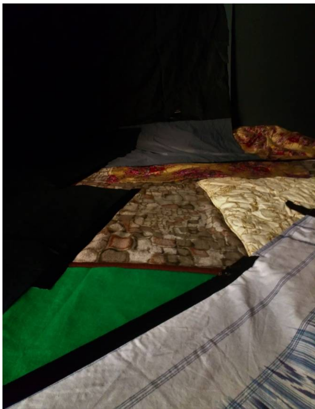
3. „Nrem staadiumid 2-4“ , foto Six

„Nrem staadiumid 2-4“ ehk sügav uni; ruum, mis oli musta kuubi kontekstis, kus päevavalguses tuli nähtavale pehme maali-installatsioon taaskasutus tekstiilist kogu ruumi ulatuses. Seisundit illustreeris sügav ja motoorne maa-lähedane heli, mis oli eksponeeritud näituse 2 – 4 päeval, mille vormi moodustasid tekid, vaibad ning tekstiil. Materjali toonid olid juhuslikud, kuid olemasolevad materjalid andsid vastavalt toonide valikule pehme valgust läbi laskva vormi, mis mõneti lasi päevavalgusel ruumi valgustada. Näituse öötundidel oli ruum vaid häguselt tajutav ning domineeriv oli heliruum, mis segunes ka unne vajumise staadiumi heliruumiga. Kui unne vajumise ruumis oli valguse küllus päeval domineerivaks siis sügava une faasis oli vaid aken ning tekstiili varjust tulev hajus valgus ruumis oleva maalilise kaasaegse skulptuuri välja toomiseks. Vorm oli kohati ruumi sulanduv ning ei tulnud ruumist välja, et jätta varju voodi imiteerimist ja esile tuua sügava une teadvustamise tajumist. Sügava une faasis oli näituse avamisel helita ruum, mis lasi vormil illustreerivast rollist välja tulla ning lõi narratiivse konteksti teose muutustele eksponeerimise ajal.