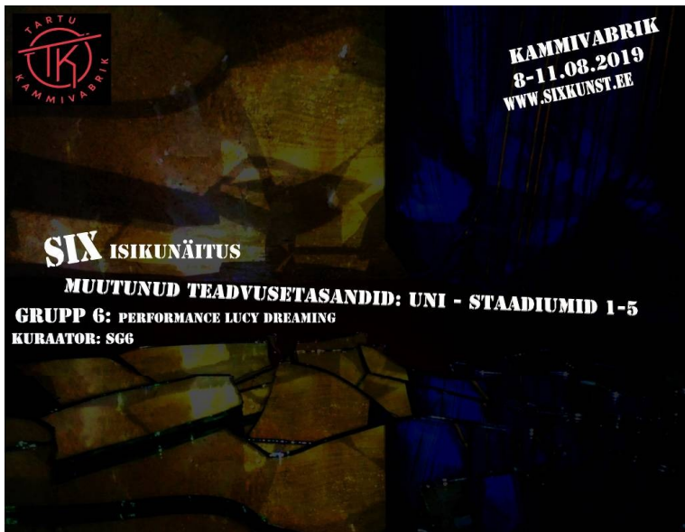
1. Plakat, disain Six