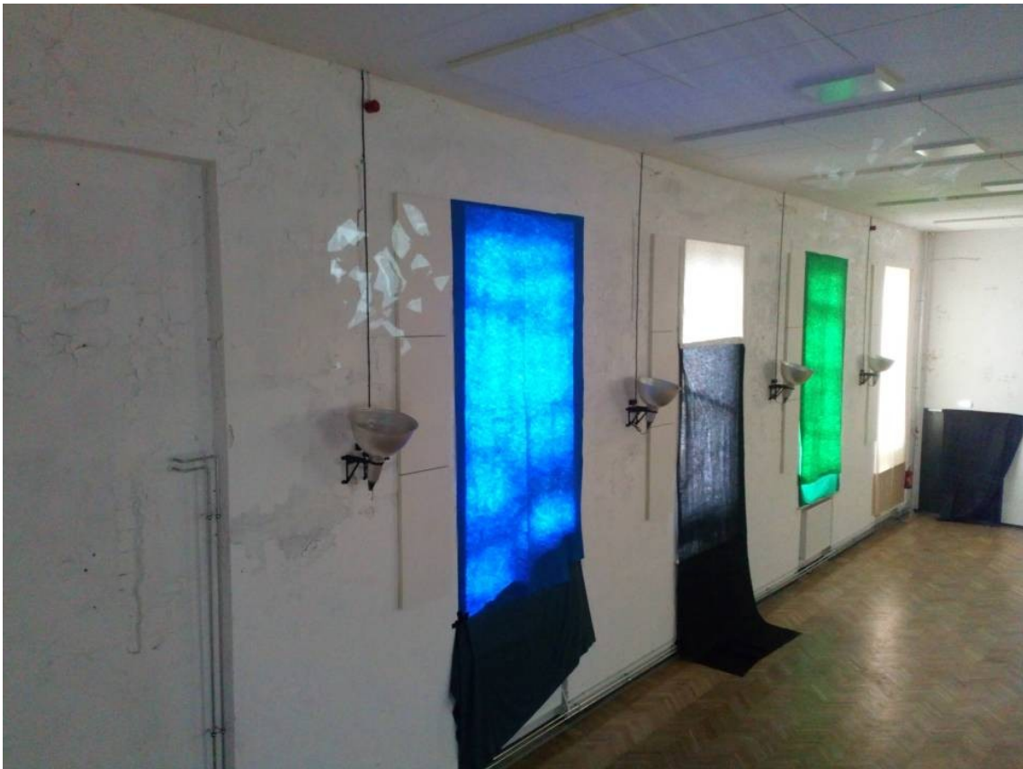
2. „Nrem staadium 1“, valgusmaalid päevavalguses

Õrna valgusemängu rõhutas motoorne dünaamiline vali müra, mis valgusemängu küllastas ning tajudega mängimist toetas. Ruumi muutuja oli valgus ning muutumatuna püsis heliruum, mis andis helile domineeriva ruumi, kus visuaalses mõttes lineaarselt levida, mis tekitas omakorda uue nüansi heli- ja valguse koosmõjust ruumis. Valguse muutusel puudus kordus päikese valguse tõttu, kus mängi rolli nii ilmastik kui valguse maalid. Heli kordus iga 45 minuti tagant, mis oli piiriks ruumis alguse ja lõpu osas. Ruumi lõpu määrasid ka kordused projektsioonide failide pikkuses ehk peegelduste tekitajad, kuid nende nähtavuse intensiivsuse reguleeris ka päikese valgus ja taaskasutus tekstiilidest valgus-maalid. Ruumis puudusid objektid, mis taas rõhutas heliruumi.