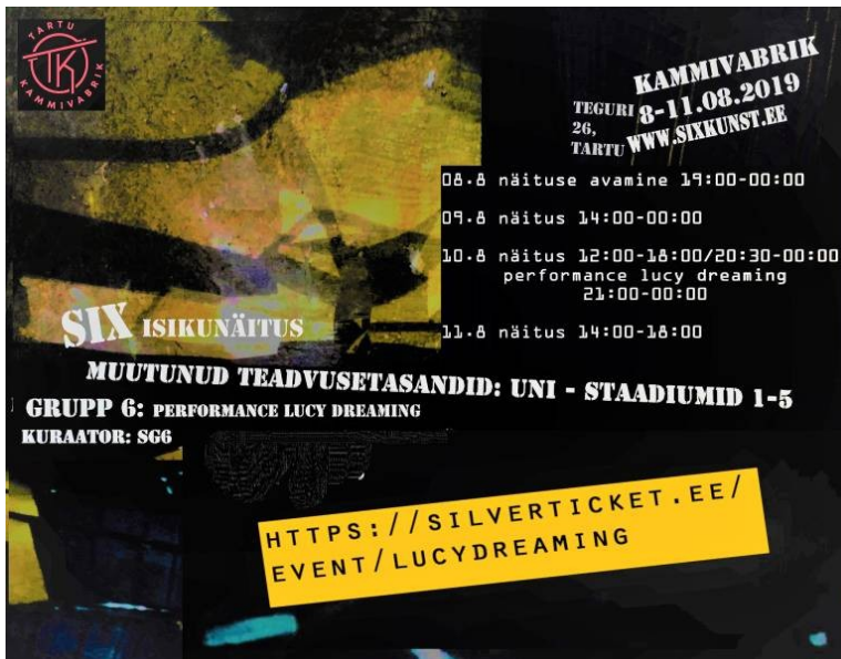
2. Lendleht, disain Six